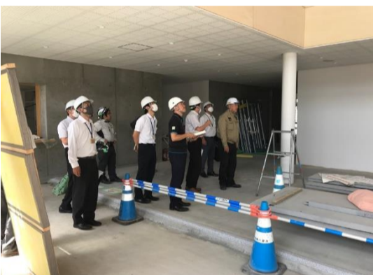
9/7 山形県総務部長が現場視察を行いました。