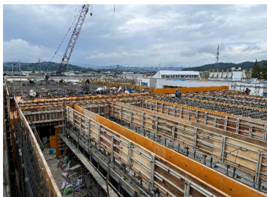
【特別棟】躯体工事でもまもなく完了、もう一踏ん張りです！