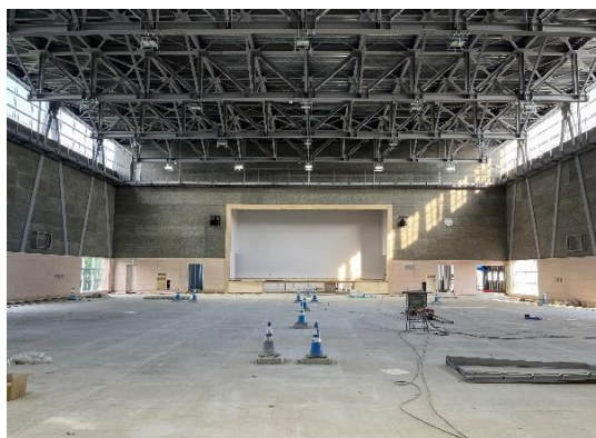
【体育館】アリーナの足場も無くなり鋼製床組をしています。