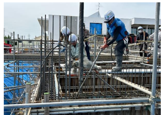
【特教棟】基礎コンクリートの打設を行いました。