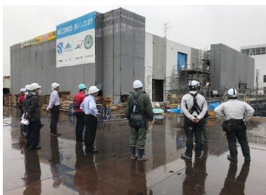
◆体育館の床組工事◆