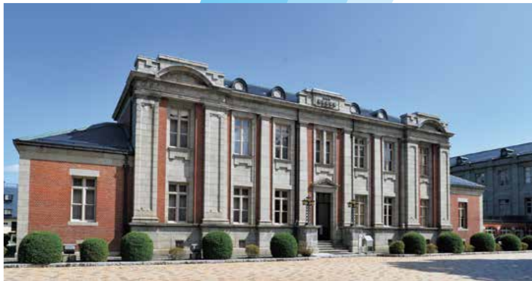
1990(平成2)年 旧県会議事堂保存修理工事

150年間受け継がれた知識と技術、そして情熱は、まだ見ぬ郷土の未来のためにこそ、生かされます。