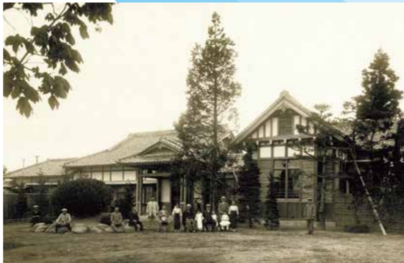
1918(大正7)年完成の知事官舎