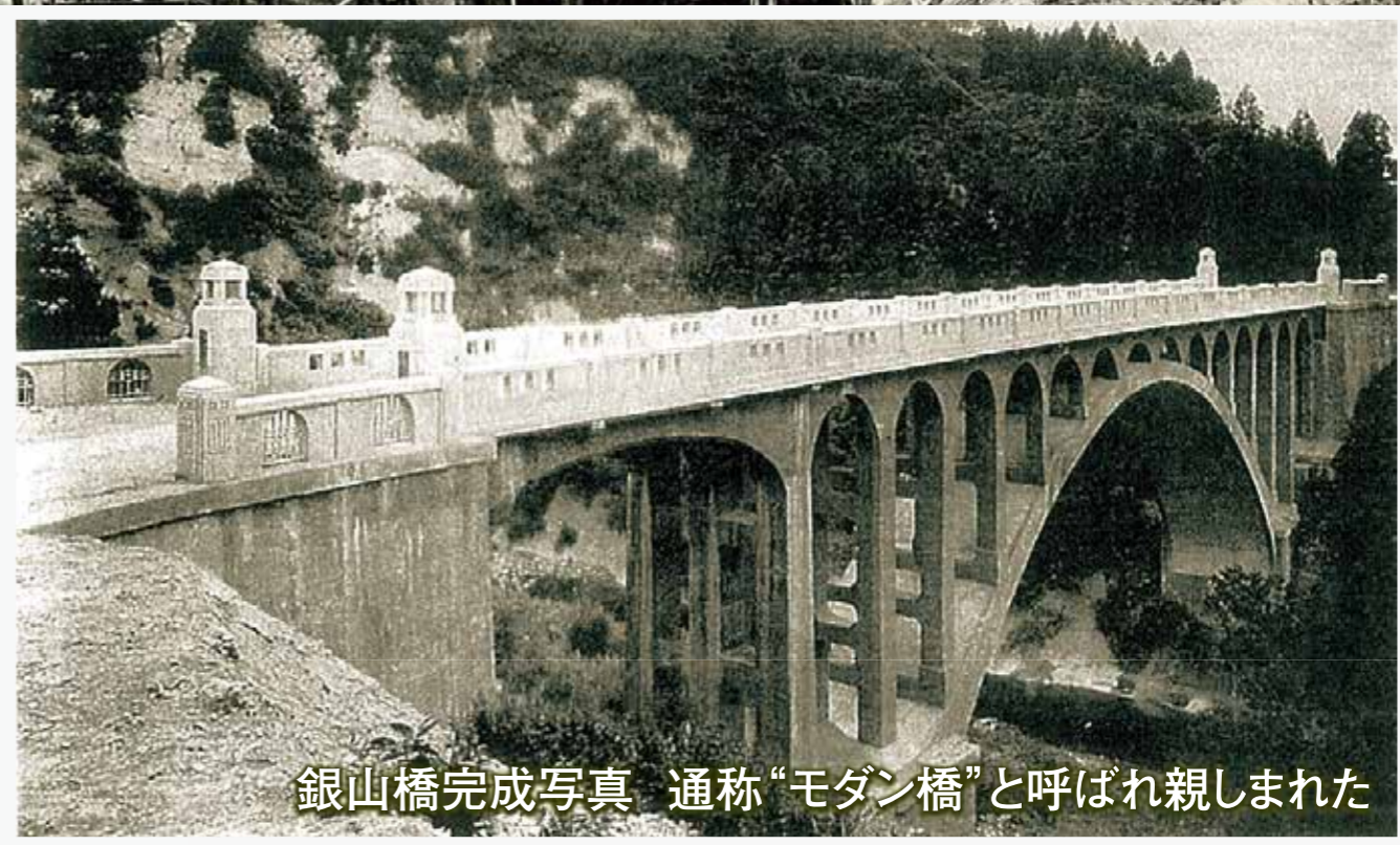
銀山橋完成写真 通称“モダン橋”と呼ばれ親しまれた