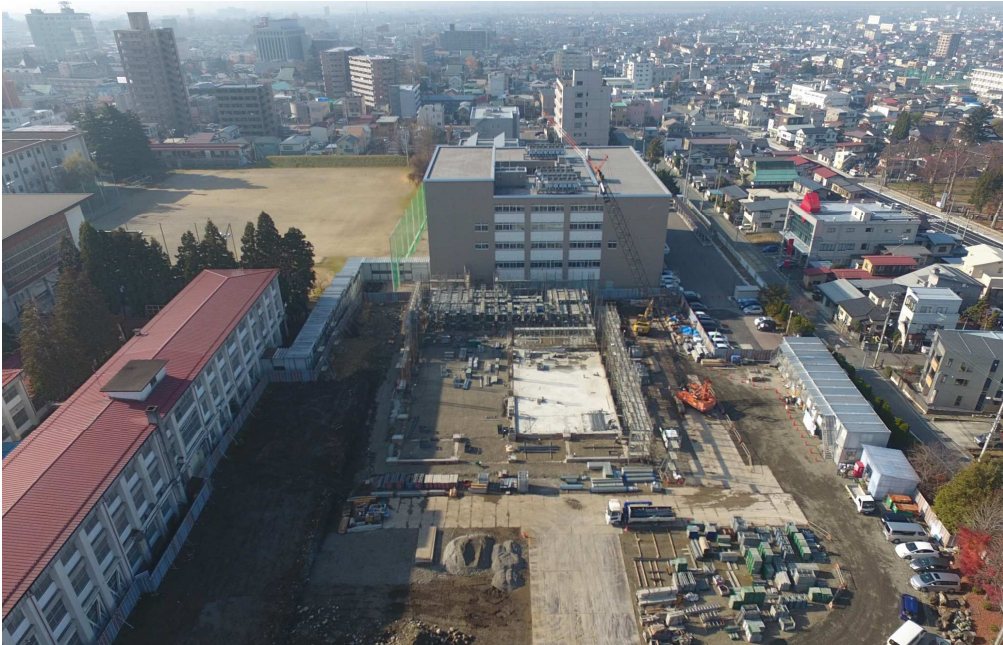
土間工事完了、1階躯体工事開始 11月28日ドローンにて撮影

まだ11月なのに今年は雪が降るのが早いような気がします。蔵王の山や龍山までまっ白です。我々建設業に携わるものとしては雪はやっかいなものです。高い山だけに降ってもらうことにしていただけないでしょうか。せめて山工体育館の1階躯体が完了するまでの年内は里に降らないで下さい。雪さんどうかよろしくお祈りします。さらにお祈りです。どうか来年も大雪になりませんよう重ねてお祈りします。