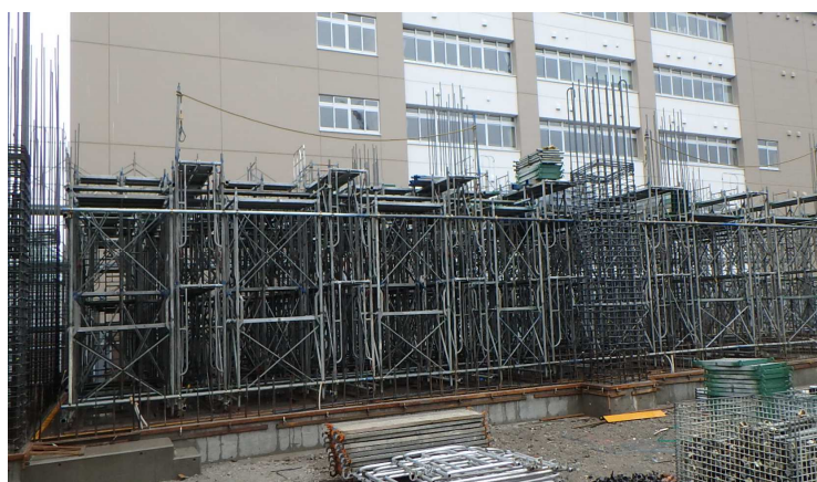
枠組支保工 (山工現場)