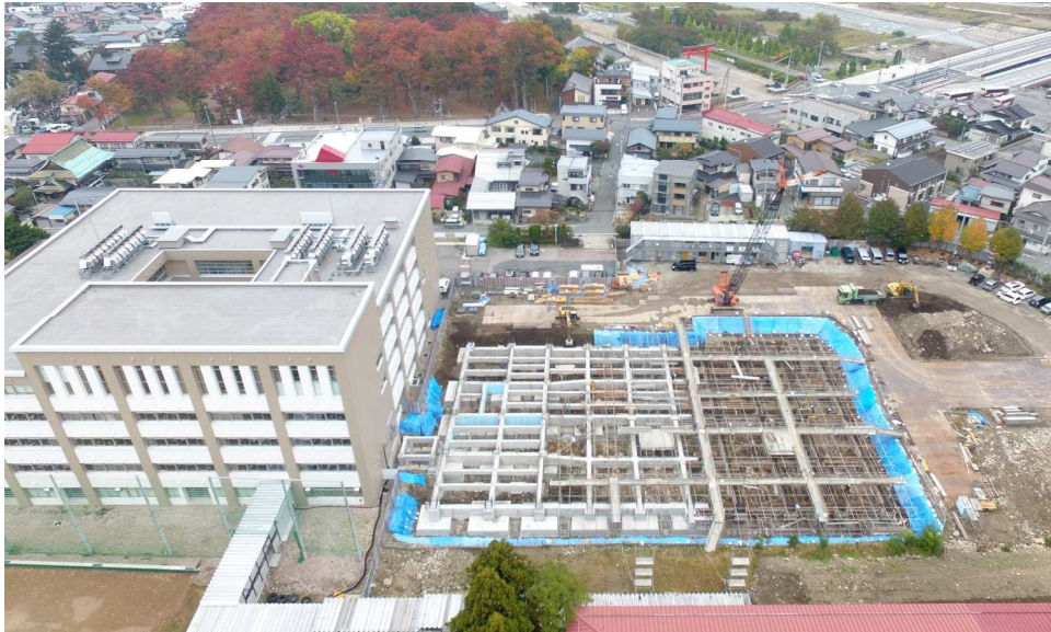
基礎工事完了した部分から埋戻し開始 10月25日ドローンにて撮影

10月20日に県会計局工事検査課による中間検査を受検し無事合格を頂きました。10月30日のコンクリート打設で基礎コンクリートの打設が終了しました。11月は1階床工事～1階躯体工事へと進めてまいります。今後も安全作業・品質管理に努めてまいります。