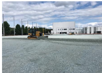
路盤碎石を敷均し、転圧