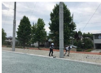
金物にワイヤーを張り、ワイヤーにネットを張り付けます