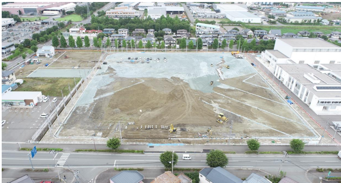
(上写真) R7.6.27南側上空より

今年の梅雨はどこにいったのかというぐらい、連日30℃以上の真夏日になっています。いよいよ夏本番となり35℃以上の猛暑日も多くなりそうですので、熱中症にならないように体調管理には気を付けたいと思います。