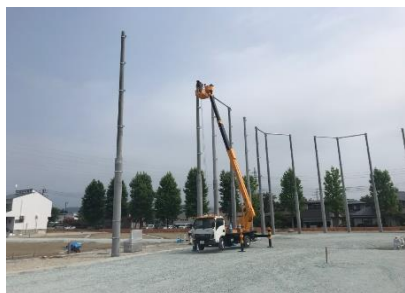
支柱に金物を取付けます