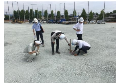
碎石の厚さを確認します