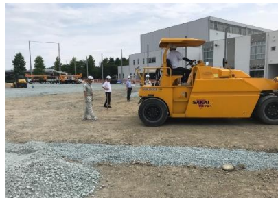
転圧し、たわみがないか確認