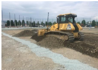
グラウンドの下層を敷均し