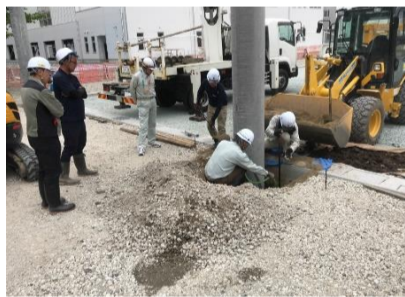
支柱の周りを埋戻し