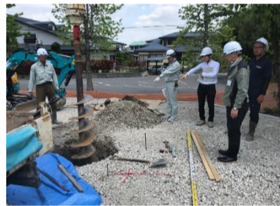
建柱車で所定深さまで掘削