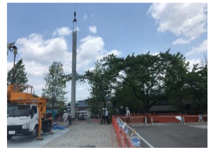
クレーンで支柱を建て込み