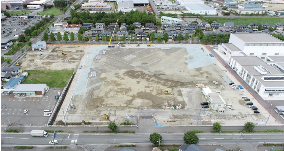
(上写真) R7.5.26南側上空より

先日とうとう梅雨入りのニュースがありました。今年の梅雨入り時期は平年並みのようです。昨年、県内では豪雨災害もありましたので、気象情報はこまめにチェックしたいところです。 さて、現場の方は、先月中旬から防球ネットの支柱建込を開始しました。想定よりも進まず手こずっていますが、次の工程のグラウンド路盤工は、予定通りは今月中旬から入れそうです。 また、旧校舎の校門だった現場の乗入口を廃止する工事も6月2週より進めています。通行しにくい状況ですがご理解とご協力をお願いします。 重機作業による騒音や振動、大型車両の出入りが続きますが、安全に工事を進めて参りますので、ご理解とご協力のほど、よろしくお願いいたします。