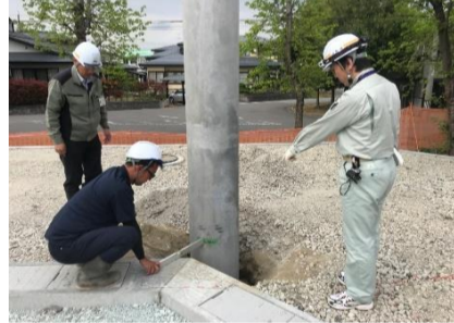
位置と深さを最終確認