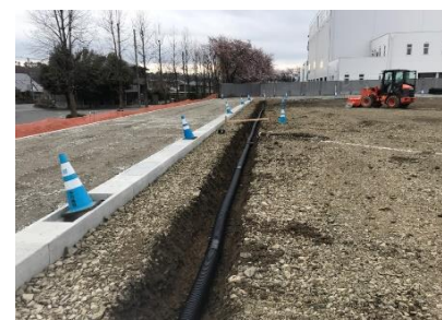
排水管を敷設します