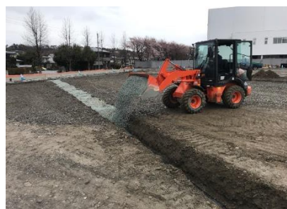
管周囲は単粒砕石で埋戻し