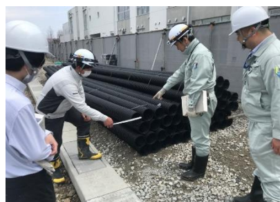
県担当者と監理者で材料確認