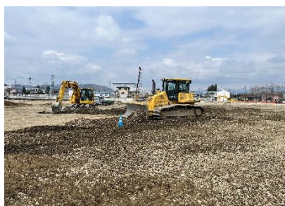
グラウンドの路床を調整