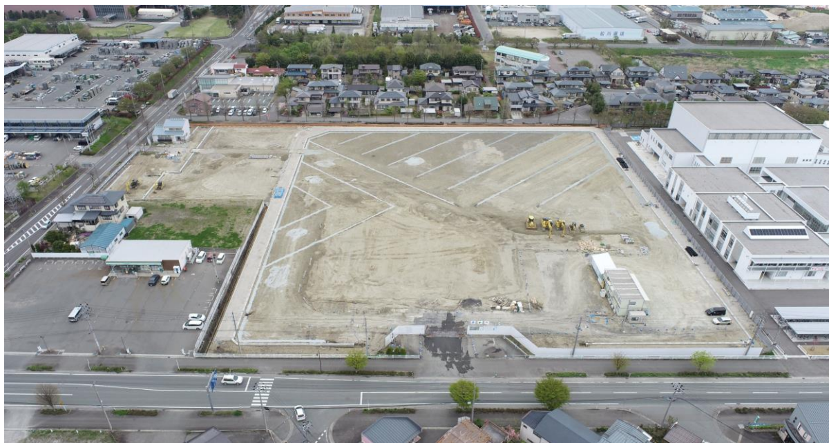
(上写真) R7.4.28南側上空より

例年であれば、5月は過ごしやすい季節のはずですが、今年は早くも25℃以上の夏日になったりして体がついて行かなくなりそうです。今年の6月から「職場における熱中症対策の義務化」されることもありますので、皆さんも体調管理には気をつけましょう。