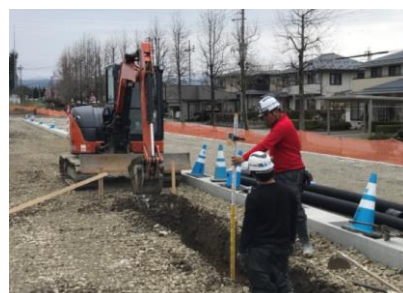
所定の深さまで掘削します