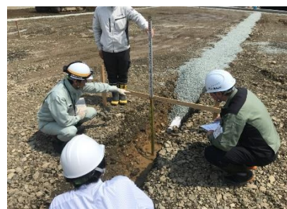
所定の位置に排水管があるか確認