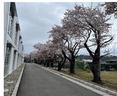
寒工高の桜 今年もきれいに咲きました

重機作業による騒音や振動、大型車両の出入りが続きますが、安全に工事を進めて参りますので、ご理解とご協力のほど、よろしくお願いいたします。