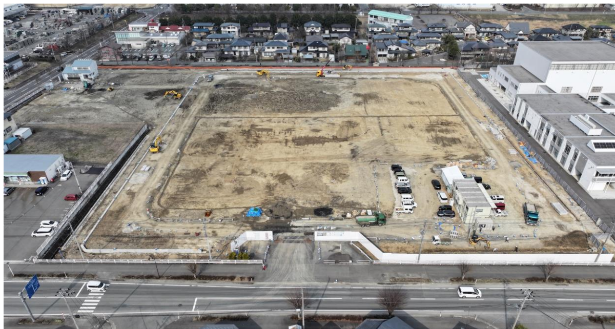
(上写真) R7.3.25南側上空より

新年度が始まり半月が経ちました。寒河江市内の桜の名所は間もなく見頃をむかえるところでしょうか。寒河江工業高校は4月8日に入学式が行われました。新入生の皆さん、入学おめでとうございます。輝くエンジニアになるため頑張ってください。